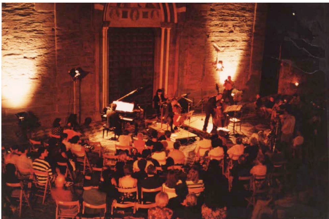
"Mosaico Andersen" Classic Jazz Quartet del Teatro Carlo Felice 26 luglio 1997